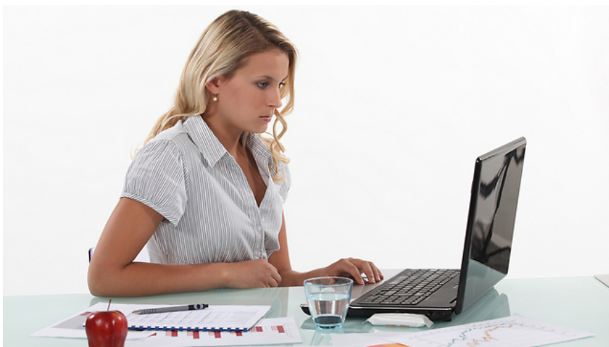
פריז וגרמניה - אוסרים להתחבר למייל של העבודה מהבית

דוגמה נוספת היא פריז - שם נחתם השבוע הסכם מול ועדי העובדים החזקים במדינה, המורה לעובדים להתנתק מהמייל של העבודה אחרי שהם חוזרים הביתה. בהסכם מצוין כי לעובד יש "מחויבות לנתק את אמצעי התקשורת", על מנת לקבל את המנוחה המינימלית על פי התקנות בצרפת ובאיחוד האירופי באשר לעומס עבודה זמן מנוחה. עוד מצוין, כי העסקים יישאו באחריות לבדוק שהעובדים לא נמצאים תחת לחץ לבדוק את הטלפון והמייל מחוץ לשעות העבודה.